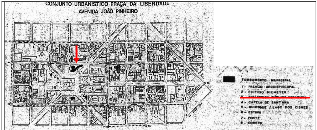
Figura 08 – Perímetro de tombamento municipal do Conjunto Urbanístico da Praça da Liberdade. Em destaque, a edificação da Biblioteca Pública.

A edificação também é protegida pelo município de Belo Horizonte, nº processo 01.059227.95.69 através da Deliberação datada de 04/12/1991, publicada em 12/12/1991, que deliberou pelo tombamento do Conjunto Urbanístico da Praça da Liberdade, conforme planta, descrição perimétrica e bens culturais constantes no Anexo I, que integra a deliberação, entre os quais se inclui o edifício da Biblioteca Pública do Estado Professor Luiz de Bessa.