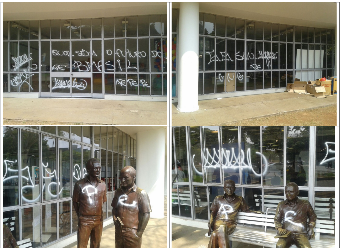
Figuras 01 a 04 – Inscrições feitas nas vidraças e estatuas de bronze.

As inscrições foram feitas nas vidraças do pavimento térreo do prédio, assim como nas pilastras, estátuas em bronze em tamanho natural intitulada “Encontro Marcado” e no muro de pedras voltado para a Avenida Bias Fortes.