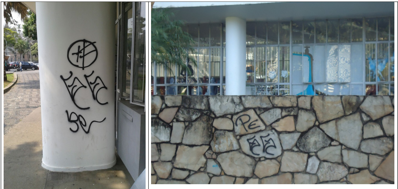
Figuras 05 a 06 – Inscrições feitas nas pilastras e muro de pedras.

Localizada na Praça da Liberdade e na Rua da Bahia, a Biblioteca foi criada em 1954 pelo então governador Juscelino Kubitschek, com projeto do arquiteto Oscar Niemeyer. Hoje integra o maior completo cultural do país - o Circuito Cultural Praça da Liberdade .