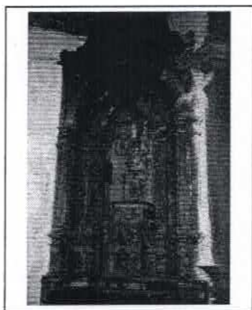
Retábulo Colateral Epístola