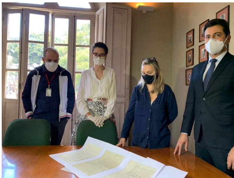
Documentos estavam sendo leiloados na internet