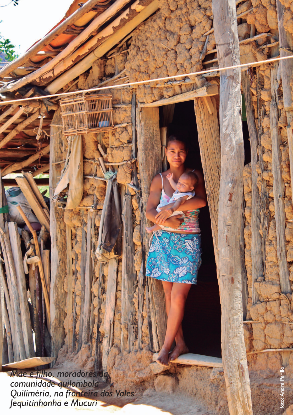
Mãe e filho, moradores da comunidade quilombola Quiliméria, na fronteira dos Vales Jequitinhonha e Mucuri