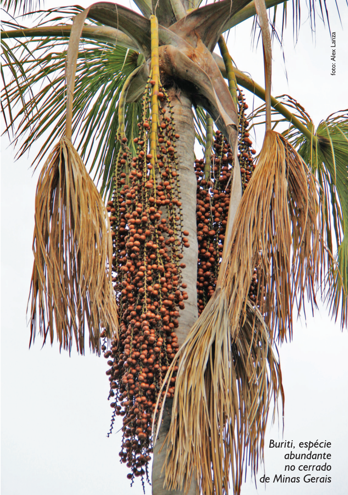
Buriti, espécie abundante no cerrado de Minas Gerais