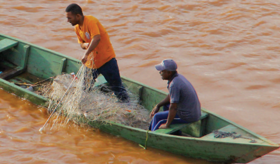
Pescadores artesanais no Rio São Francisco, próximo ao município de Januária