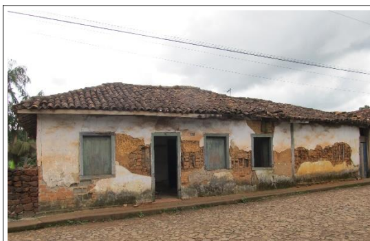
Figura 05 – Imagem do imóvel em 2014.

Em vistoria realizada no Distrito por este Setor Técnico em março de 2014, verificou-se que houve avanço do estado de degradação do imóvel. Além do descolamento do reboco, passou a apresentar abatimento da cobertura e encontrava-se exposto às ações do tempo e de vandalismo, tendo em vista que as esquadrias se encontravam abertas, possibilitando o acesso ao interior do imóvel.