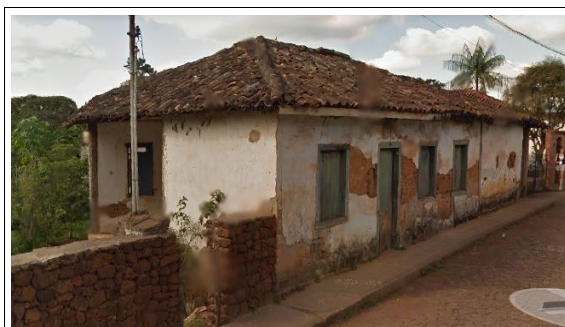
Figura 03 – Imagem da edificação em 2012.

Em análise as imagens do Google Street View, constatamos em julho de 2012 o imóvel encontrava-se aparentemente sem uso, em início de processo de arruinamento, apresentando descolamento de reboco, expondo o sistema construtivo a base de terra.