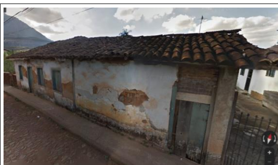
Figura 04 – Imagem da edificação em 2012.