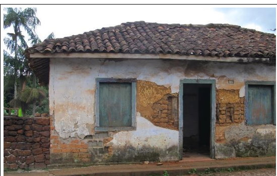
Figura 06 – Imagem do imóvel em 2014.