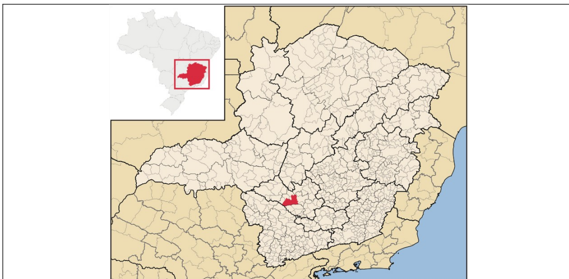
Figura 1 – Localização da cidade de Formiga no estado de Minas Gerais.