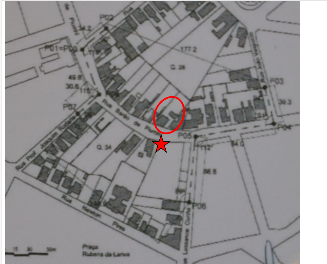
Figura 01 – Localização da Capela e da edificação em análise, inserida dentro da poligonal de entorno de tombamento.

Além disso, a edificação insere-se no perímetro de entorno de tombamento da Capela Nossa Senhora da Aparecida, tombada pelo município através do Decreto nº 5678/2012.