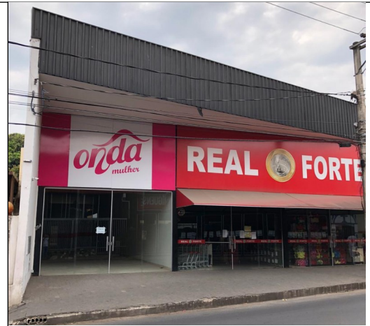
Figura 05 – Edifício construído atualmente no local.