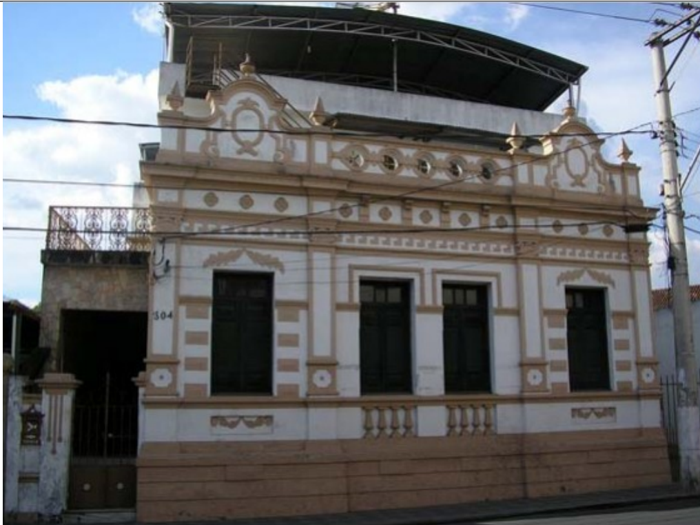
Figura 02 - Imagem do imóvel em setembro de 2007.