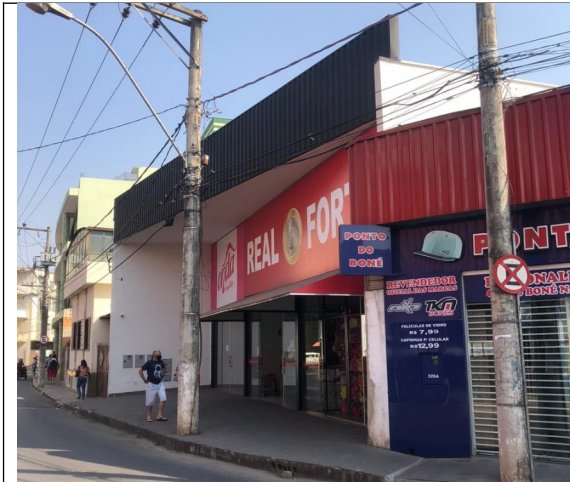
Figura 04 – Edifício construído atualmente no local.