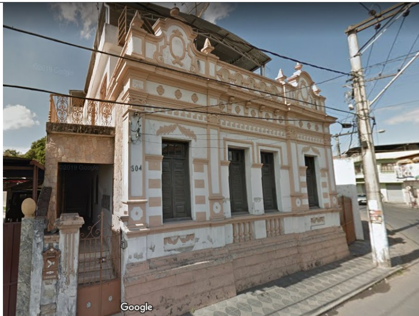
Figura 03 – Imagem do imóvel em setembro de 2011.

O imóvel foi completamente demolido. Segundo informado pela prefeitura, a demolição ocorreu antes da emissão da certidão de demolição, datada de 18/06/2013, protocolo nº 913, e sem prévia autorização do Conselho Municipal de Patrimônio Cultural, necessária por se tratar de bem inventariado e situado no perímetro de entorno de tombamento da Capela Nossa Senhora Aparecida.