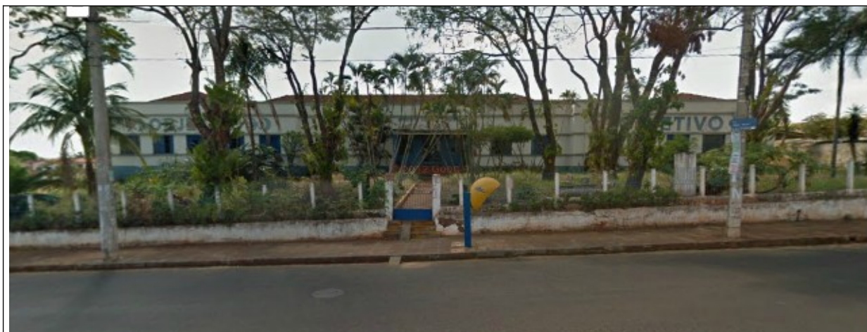
Figura 02 – Fachada atual da edificação.