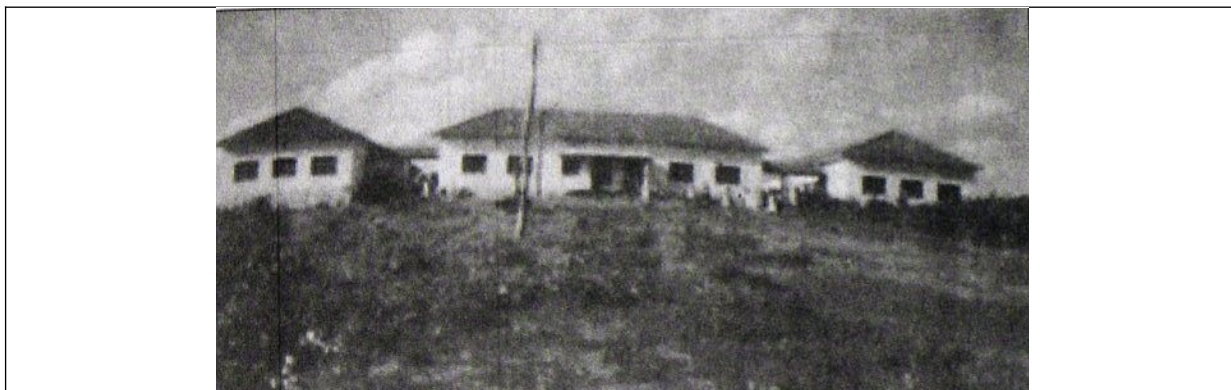
Figura 01 – Prédio do Ginásio de Frutal, pouco depois da inauguração – em funcionamento.