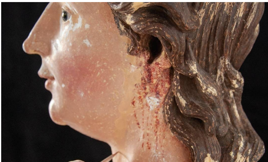
A imagem de São Manoel, o santo da “paciência”, em trabalho de restauração.