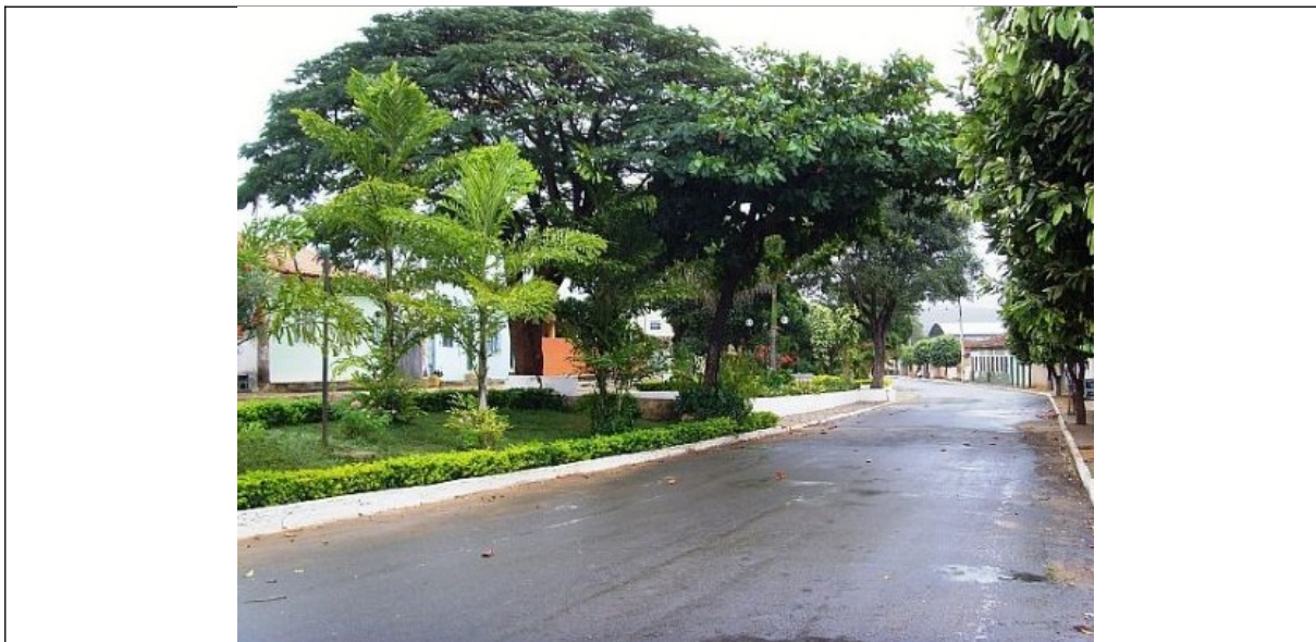
Figura 07- Praça Antônio Pereira em Indaiabira.