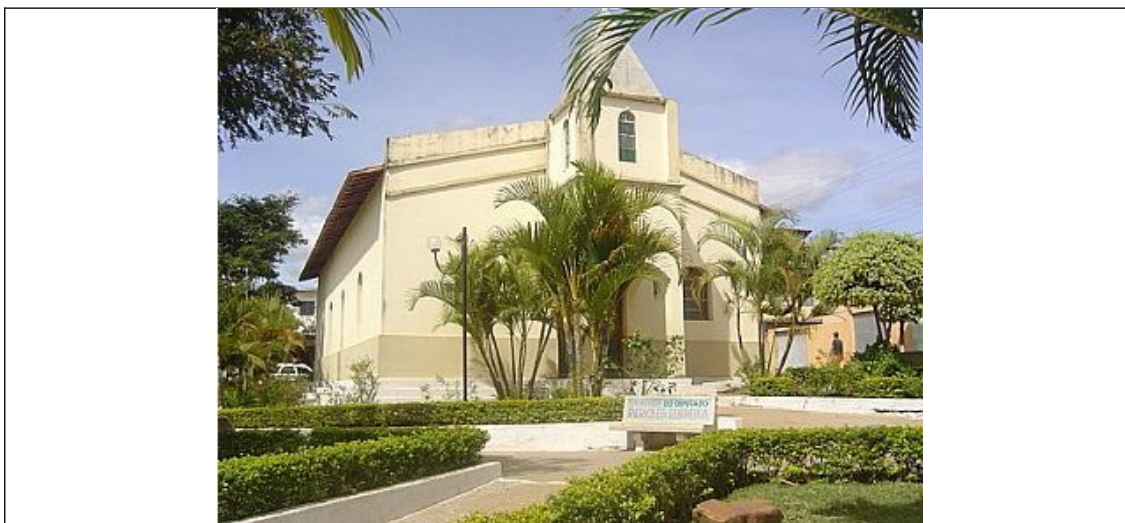
Figura 03– Igreja de Nossa Senhora da Piedade. Fonte: http://www.ferias.tur.br . Acesso outubro 2012.