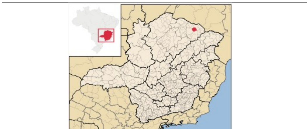
Figura 01 – Imagem contendo a localização do município de Indaiabira.