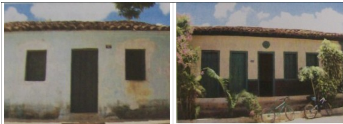
Figuras 04 e 05- Casa de Sebastiana Lacerda e casa de Regino, imóveis inventariados pelo município de Indaiabira.