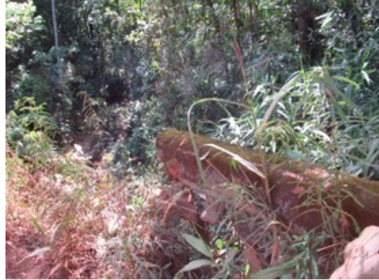
Figuras 31, 32, 33 e 34- Pontes existentes no trecho da Rodovia MG-030, mais próximas a Itabirito. Fotos da vistoria.