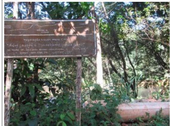
Figuras 25, 26 e 27-Mirante existente no trecho da Rodovia MG-030 entre Itabirito e Rio Acima, com presença de sinalização turística. Fotos da vistoria.

Outro ponto em que há sinalização turística corresponde ao Chafariz de Nossa Senhora Aparecida. A placa também está em precário estado de conservação, mas é possível identificar a informação de que a vegetação local se trata de Mata Atlântica.