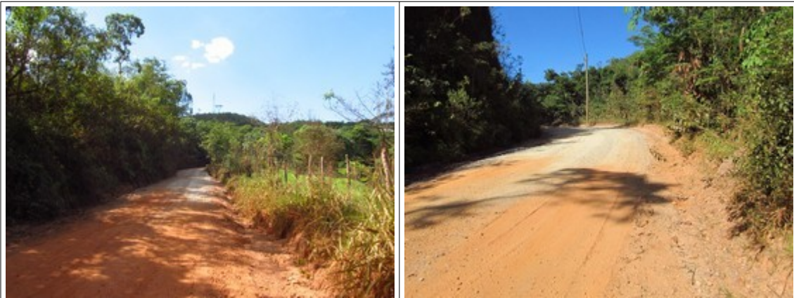
Figuras 13 e 14- Trechos da Rodovia MG-030 onde se verificou deposição de cascalho. Fotos da vistoria.

Em diversos pontos da rodovia, verificou-se a deposição de cascalho, evidenciando que o trecho passa por alguma manutenção.