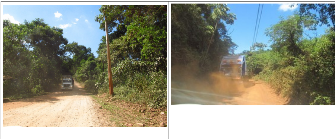
Figuras 6 e 7- Tráfego de caminhões na Rodovia MG-030. Fotos da vistoria.

No decorrer do percurso, verificou-se que, embora pouco movimentada, a rodovia possui tráfego de caminhões, que geram muita poeira com sua circulação.