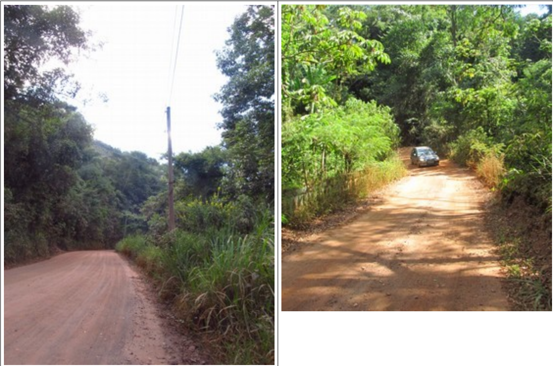
Figuras 2 e 3- Rodovia MG-030, em Itabirito. Fotos da vistoria.

Constatou-se que a rodovia não é pavimentada e, em diversos pontos, apresenta-se bastante estreita.