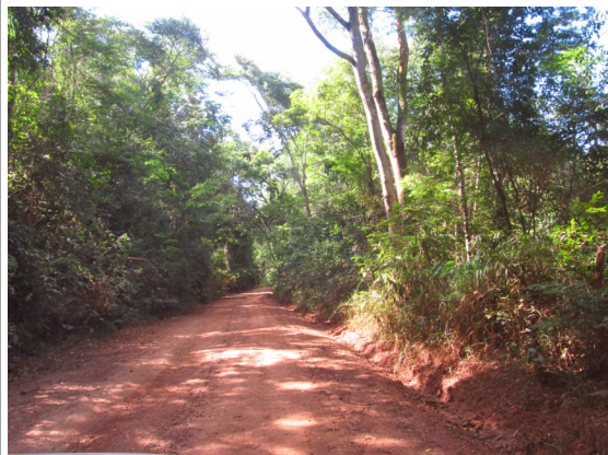
Figuras 19 e 20- Exuberância da vegetação no trecho da Rodovia MG-030 entre Itabirito e Rio Acima. Fotos da vistoria.