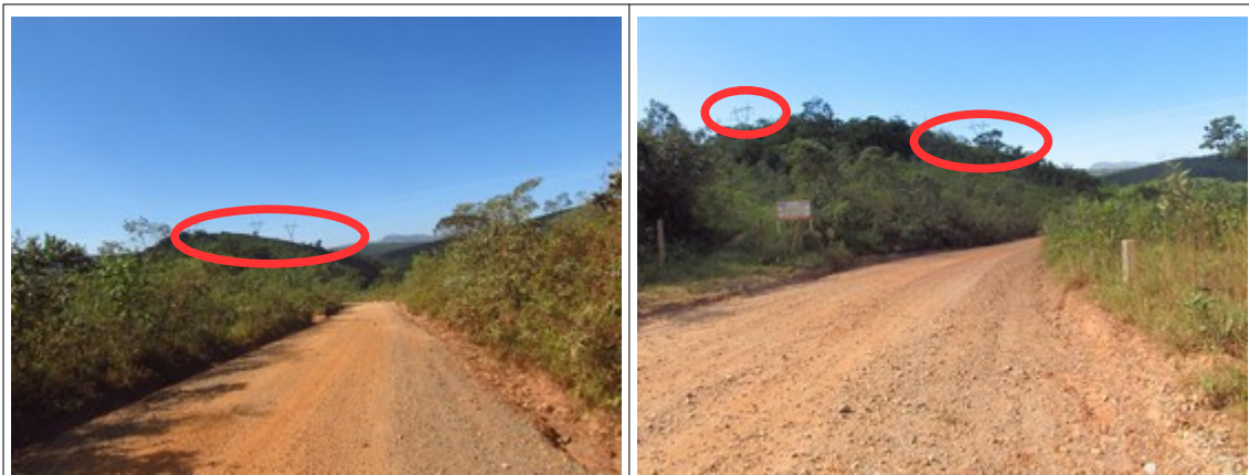
Figuras 43 e 44- Presença de torres de transmissão de energia elétrica no trecho da Rodovia MG-030, mais próximo a Rio Acima. Fotos da vistoria.

d) Impactos visuais e paisagísticos das torres de linhas de transmissão de energia: embora marcada pela beleza cênica, o trecho da Rodovia MG-030 entre Itabirito e Rio Acima já se encontra impactado negativamente pela presença de torres de linhas de transmissão de energia elétrica, sobretudo próximo a Rio Acima. Há, inclusive, placas alertando para risco de acidentes na área.