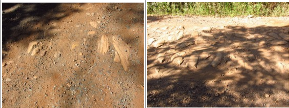
Figuras 15 e 16- Vestígios de calçamento na Rodovia MG-030. Fotos da vistoria.

A presença de animais também foi constatada, embora não houvesse na rodovia sinalização atentando para essa possibilidade.