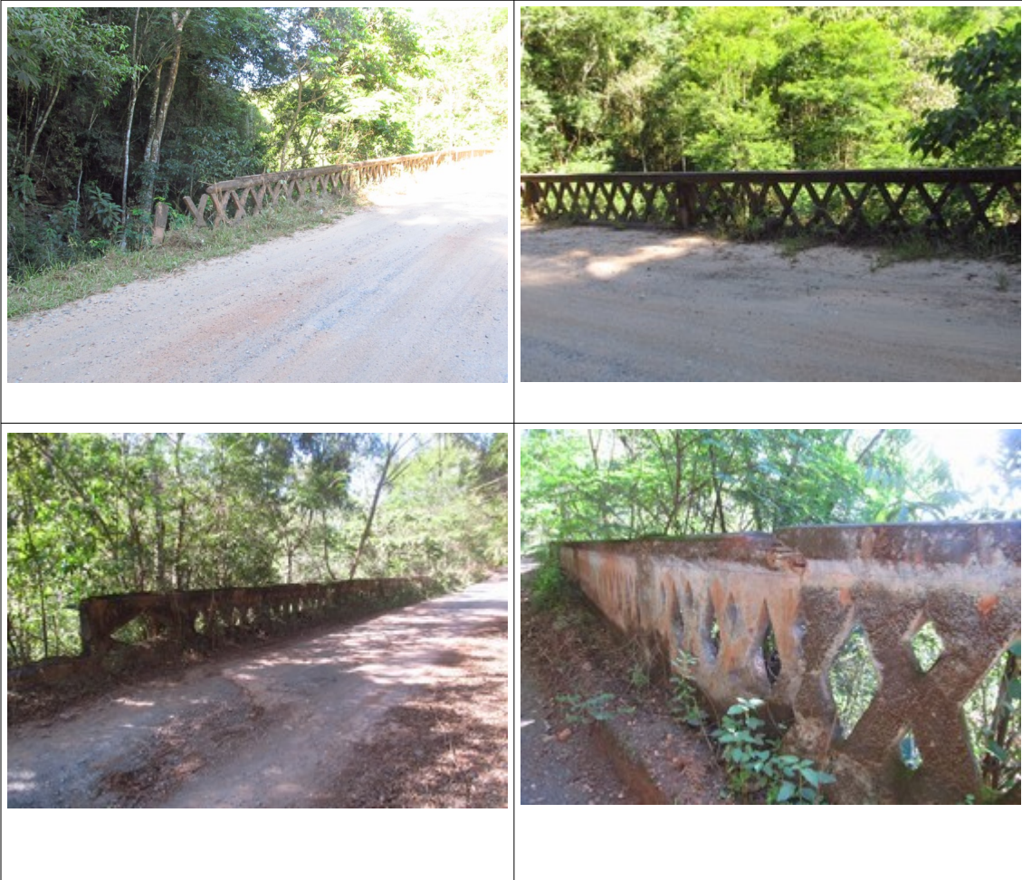
Figuras 35, 36, 37, 38, 39 e 40- Outras pontes existentes no trecho da Rodovia MG-030. Fotos da vistoria.

Nas proximidades de Rio Acima foi também identificado um “pontilhão”, no qual verificou-se a inscrição do ano de “1927”.