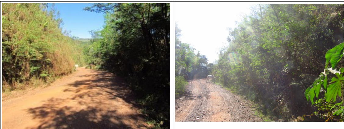
Figuras 17 e 18- Presença de animais na Rodovia MG-030. Fotos da vistoria.

A presença de animais também foi constatada, embora não houvesse na rodovia sinalização atentando para essa possibilidade.