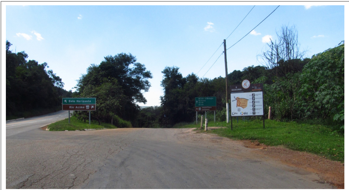
Figura 1- Rodovia MG-030, na interseção com a BR-356, em Itabirito. Foto da vistoria.

Constatou-se que a rodovia não é pavimentada e, em diversos pontos, apresenta-se bastante estreita.