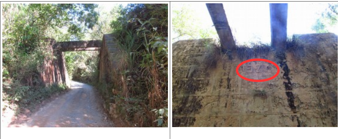
Figuras 41 e 42- Pontilhão existente no trecho da Rodovia MG-030, mais próximo a Rio Acima. Fotos da vistoria.

Nas proximidades de Rio Acima foi também identificado um “pontilhão”, no qual verificou-se a inscrição do ano de “1927”.