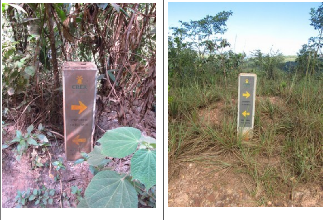
Figuras 22 e 23-Totens indicando o “Caminho Religioso da Estrada Real” (CRER) no trecho da Rodovia MG-030 entre Itabirito e Rio Acima. Fotos da vistoria.

O Caminho Religioso da Estrada Real abrange 38 municípios, sendo 32 mineiros e 06 paulistas, saindo do Santuário Estadual da Serra da Piedade em direção ao Santuário Nacional de Aparecida 11 . Segue parte do mapa do percurso que, dentre outros municípios mineiros, inclui Itabirito e Rio Acima.