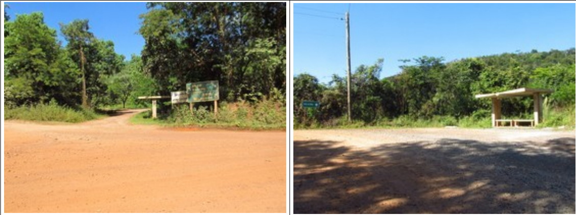
Figuras 11 e 12- Trechos da Rodovia MG-030, com a presença estruturas de pontos de ônibus e placa indicando uma escola municipal na região. Fotos da vistoria.

Outras estruturas de ponto de ônibus foram verificadas no trajeto, indicando que se trata de uma rodovia bastante utilizada pela população. Verificou-se ainda uma placa indicando o acesso para a Escola Municipal Antônio Toledo Sobrinho.