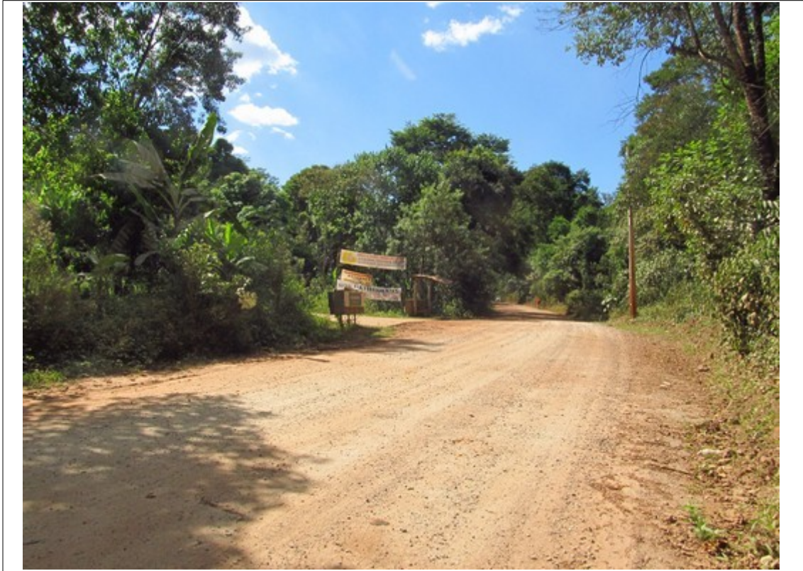
Figura 8- Trecho da Rodovia MG-030 onde se verificou maior concentração de casas. Foto da vistoria.

Ao longo da rodovia, constatou-se a presença de casas esparsas, havendo um trecho mais próximo a Itabirito, onde há maior concentração de residências, bem como presença de igrejas, comércio e estrutura de ponto de ônibus.