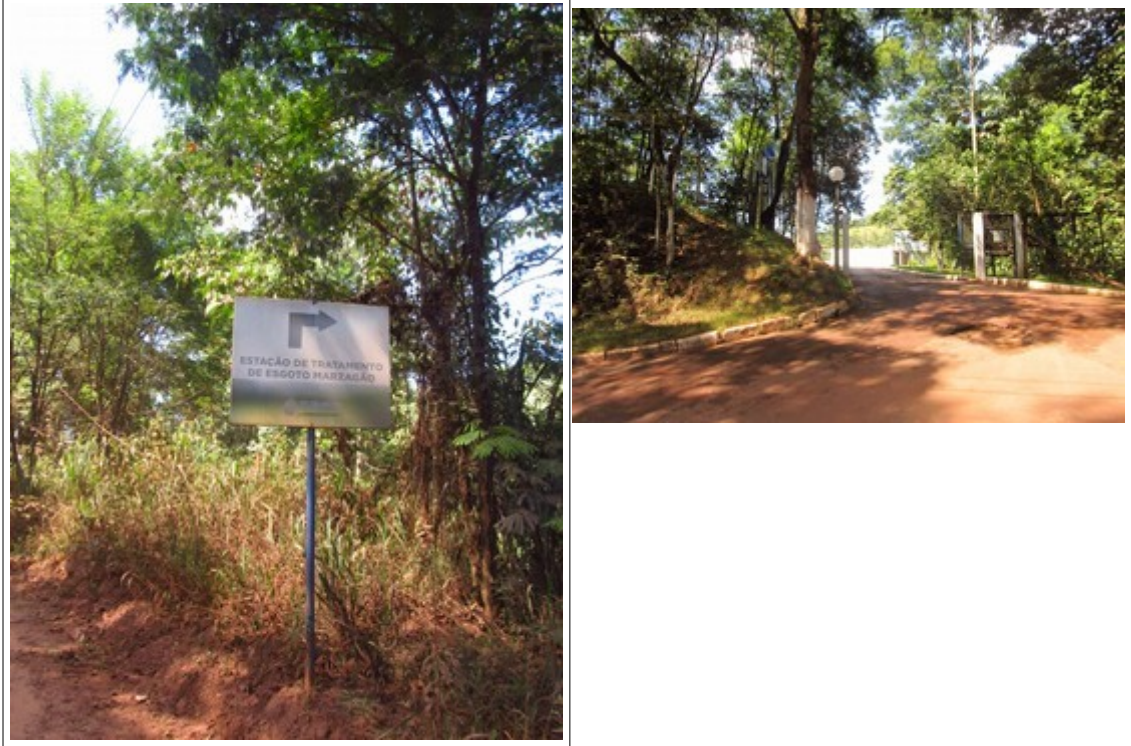
Figuras 4 e 5- Sinalização indicativa da Estação de Tratamento de Esgoto Marzagão localizada às margens da Rodovia MG-030, em Itabirito. Na 2ª imagem a portaria da ETE. Fotos da vistoria.

Logo no início do percurso, verificou-se sinalização indicativa da Estação de Tratamento de Esgoto Marzagão, cuja portaria fica às margens da rodovia.