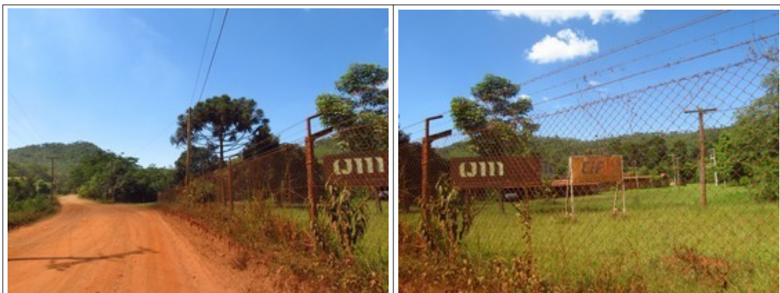
Figuras 9 e 10- Presença de instalações de uma indústria, aparentemente desativada, na Rodovia MG-030. Fotos da vistoria.

Verificou-se também às margens da rodovia, a presença de instalações de uma indústria que, aparentemente, está desativada.