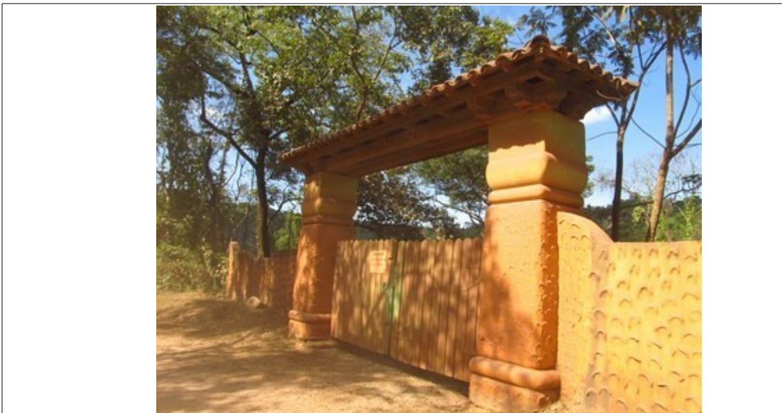
Figura 45- Usina do Bonga no trecho da Rodovia MG-030, mais próximo a Itabirito. Fotos da vistoria.

Por fim, é importante ressaltar que, próximo a Itabirito, passamos pela Usina do Bonga, indicada como sítio arqueológico no Relatório Final de Diagnóstico Arqueológico apresentado ao IPHAN, em março de 2014, na fase de obtenção da LP + LI. Neste documento, foi relatada a existência do “sítio Aqueduto do Bonga” que possui alguns metros de sua extremidade sudeste na ADA do empreendimento. Foi recomendada uma alteração pontual no projeto da rodovia para integral preservação desta estrutura.