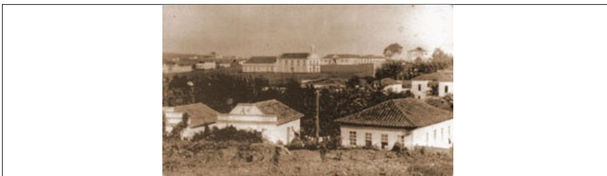
Figura 02 – vista panorâmica antiga da cidade.

se chegar a uma decisão amigável. O fato é que um amigo comum sugeriu a maneira de se resolver a perlanga e que foi unanimemente aceita: Numa manhã combinada saíram à mesma hora, a cavalo, de suas respectivas casas, caminhando cada um em direção à residência do outro. Perto do ribeirão “Jorge Pequeno” deu-se o encontro (...) aí puseram o marco divisório. (...) ficou resolvido que naquele mesmo local fosse ereta uma capela (...) Conhecido o voto da esposa, foi lhe dado como orago Nossa Senhora da Luz e uma vez erguida a capela e passada a escritura de doação patrimônio, o vigário de Bambuí foi Benzê-la, tornando-a filial de sua matriz.”