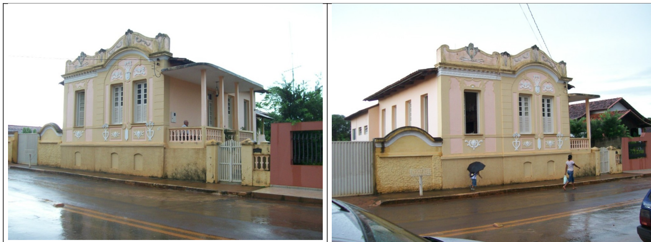
Figuras 03 e 04 – Vistas do imóvel.