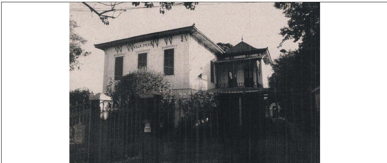
Figura 10- Villa Sylvania, 2000.