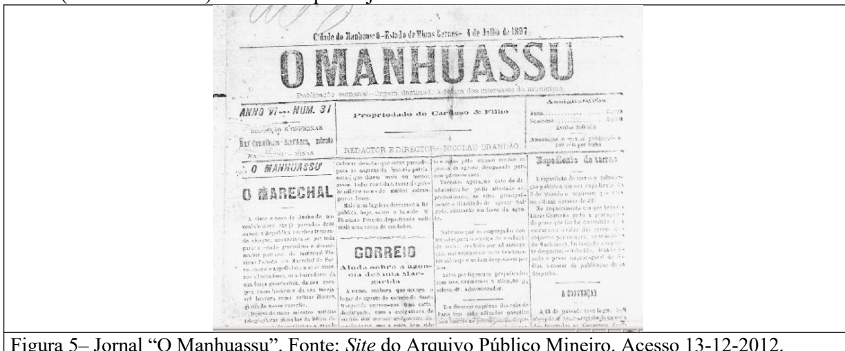
Figura 5– Jornal “O Manhuassu”.

No que se refere aos eventos locais de Manhuaçu foi localizado no site do Arquivo Público Mineiro periódico do município denominado “O Manhuassu”, datado de 4 de julho de 1897 (criado em 1890). Abaixo capa do jornal.