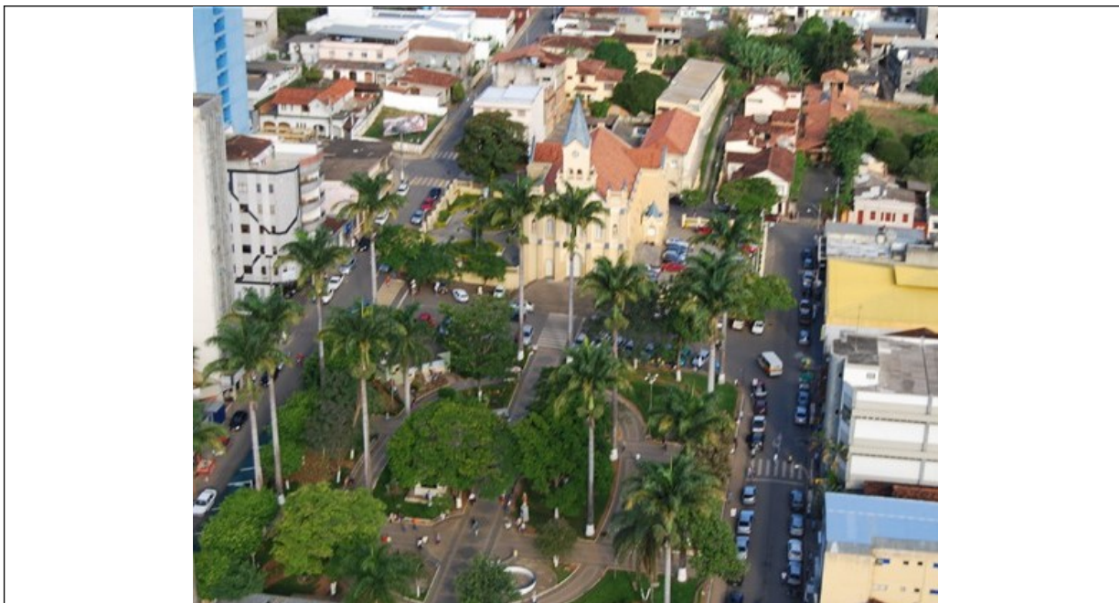
Figura 9- Vista aérea da cidade de Manhuaçu.