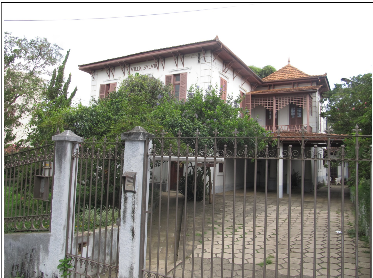
Figura 11- Imóvel inventariado localizado na Rua Nudant Pizelli Souza, 265, Manhuaçu.

O imóvel possui valor cultural, já reconhecido pelo município que realizou o seu inventário no ano de 2000. Podemos destacar que a edificação acumula os seguintes valores: