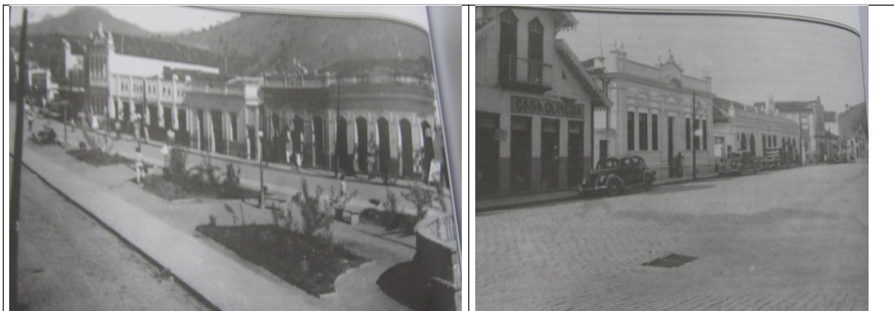
Figuras 3 e 4 – Imagens antigas do centro de Manhuaçu.