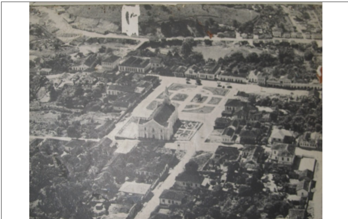
Figura 2 – Vista aérea do antigo centro de Manhuaçu.