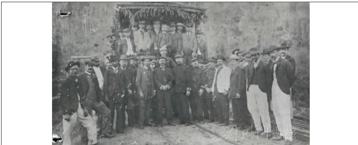
Figura 6 – Foto na ponte metálica sobre o Rio Manhuaçu, por ocasião da excursão feita pelo senador João Luiz Alves à linha da E. de Ferro Vitória-Diamantina na data de 31 de setembro de 1908. Acesso em 13-12-2012.