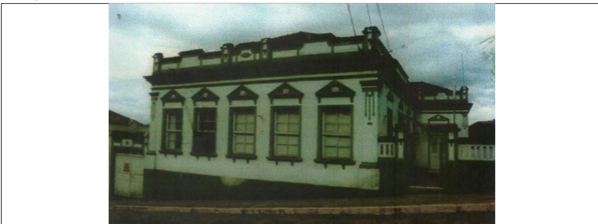
Figura 03 – A edificação no ano de 2000.

para abrigar a biblioteca municipal e escola de música, permanecendo com este uso até o ano de 2014.