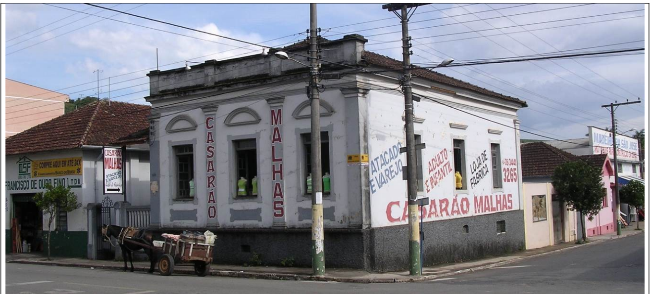
Figura 10 – Casarão das malhas, demolido recentemente.

Conforme descrevem os artigos 30, IX e 216, caput da Constituição Federal: