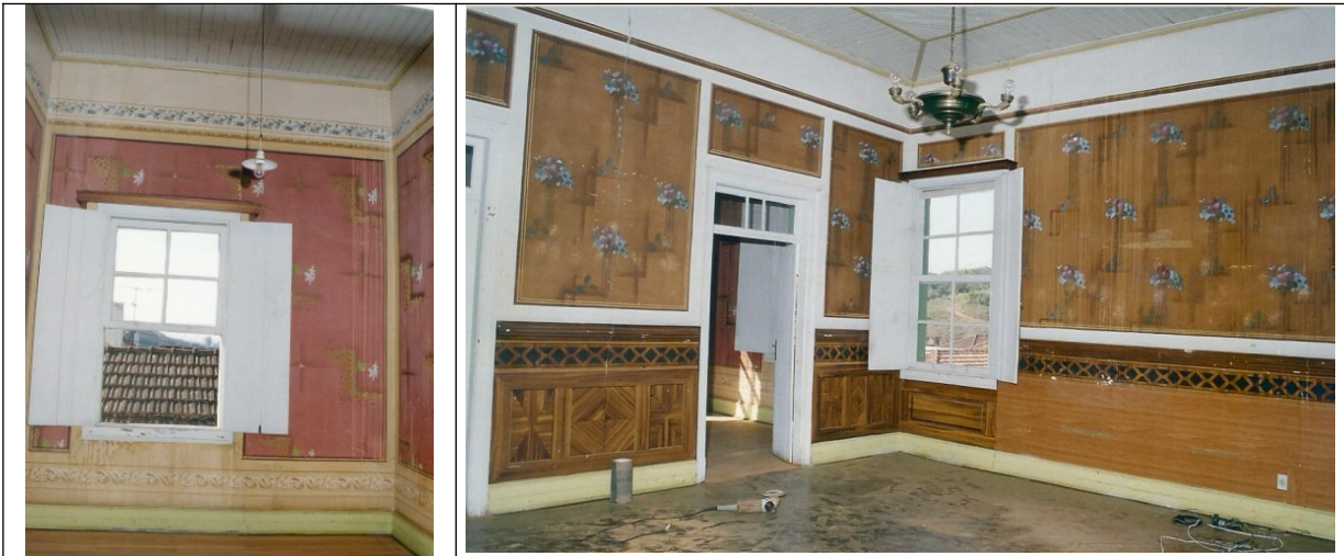
Figuras 06 e 07 – Imagens internas do imóvel.