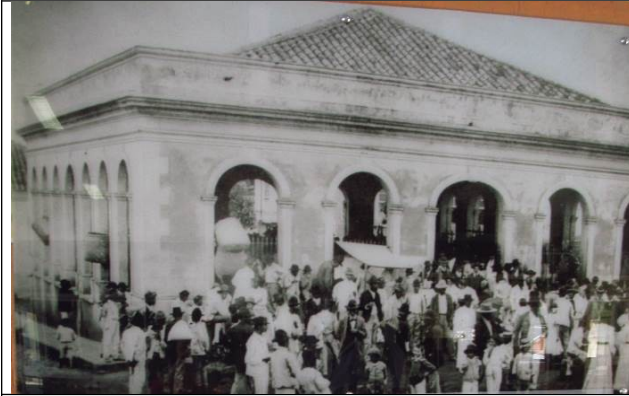
Figura 08 – Antigo Mercado Municipal.

quais destacamos o Mercado Municipal (que cedeu lugar ao atual centro cultural), antigo Teatro Ouro Finense (que se localizava perto da atual rodoviária), e o imóvel conhecido como Casarão das Malhas, demolido recentemente, na rua Guarda Mór Lustosa.