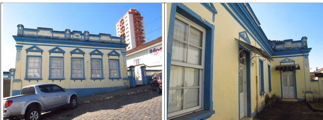
Figuras 04 e 05 – Fachadas do imóvel.

As esquadrias são em madeira no sistema guilhotina e a cobertura desenvolve-se em quatro águas com vedação em telhas francesas. Internamente, possui pinturas decorativas