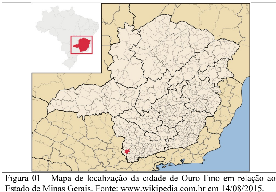
Figura 01 - Mapa de localização da cidade de Ouro Fino em relação ao Estado de Minas Gerais.

Este laudo técnico tem como objetivo propor proteção através do tombamento ao imóvel de valor cultural que foi inventariado pelo município, conhecido como Casa do Acordo Café com Leite, localizado na rua Júlio Brandão nº 241.