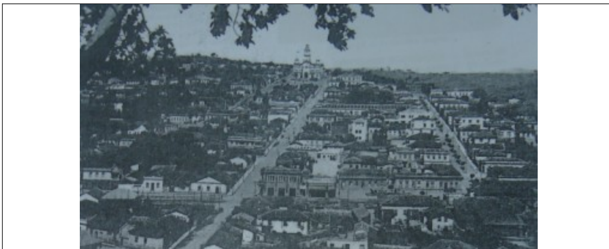
Figura 02 – Vista parcial do município de Ouro Fino.