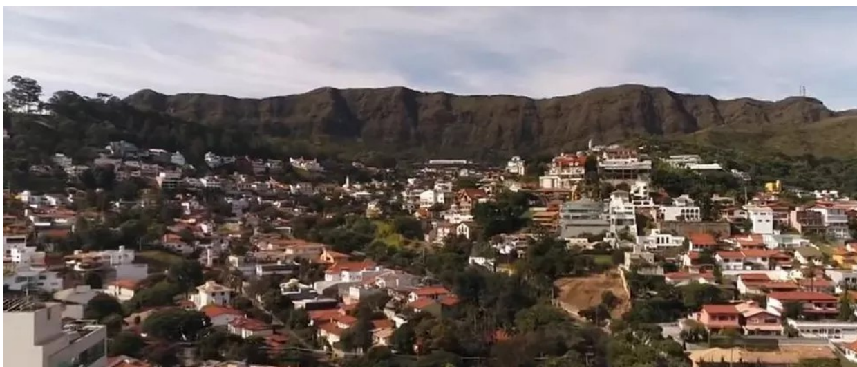
Paredão da Serra do Curral

A Serra do Curral tem 14 quilômetros de extensão. O paredão “emoldura” um dos muitos “horizontes” da capital. Além de Belo Horizonte, Sabará e Nova Lima também abrigam a Serra do Curral.