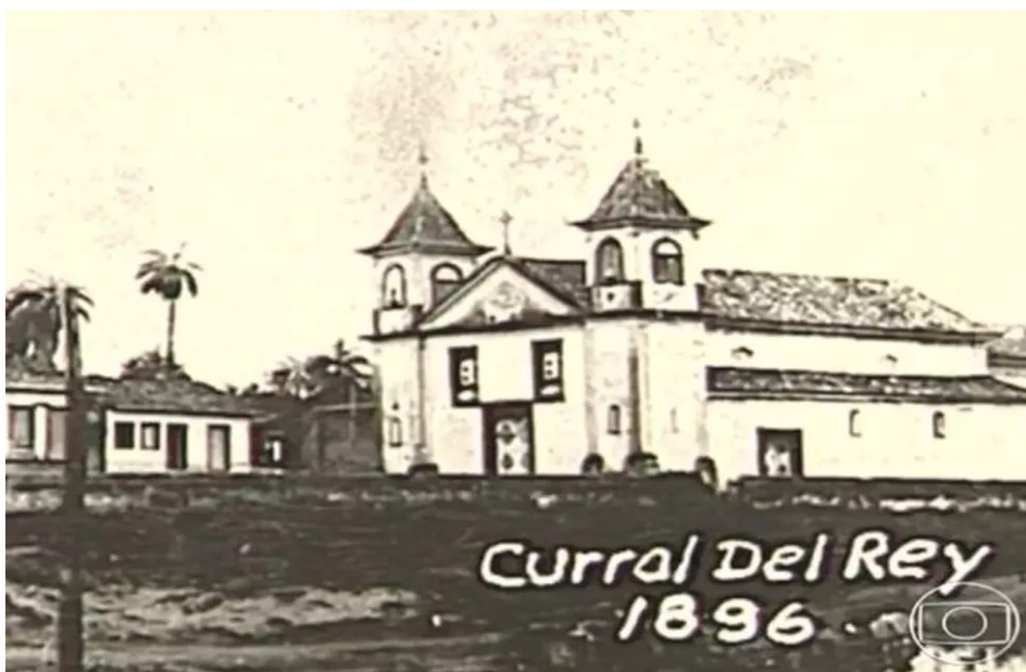
Curral Del Rey antes de se tornar Belo Horizonte