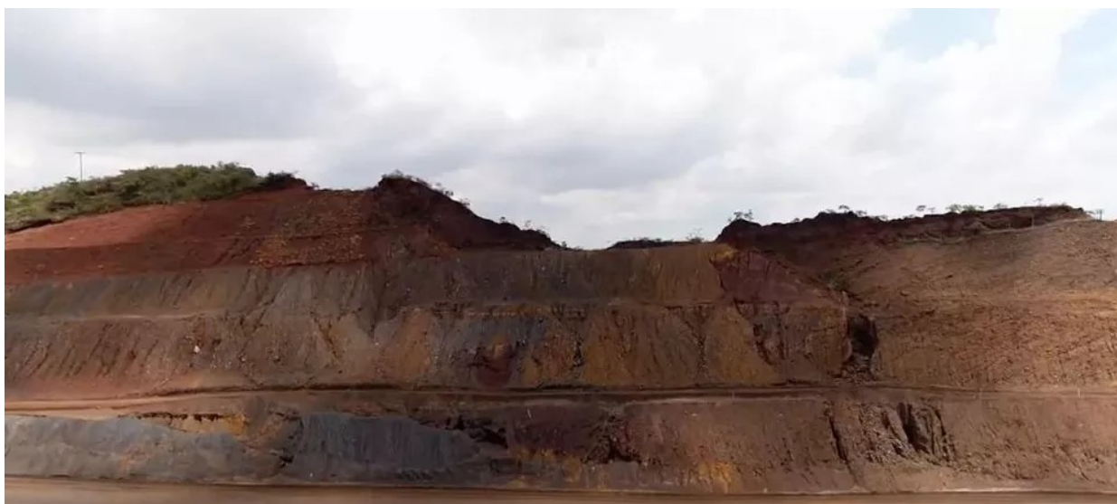
Parte de trás do paredão da Serra do Curral