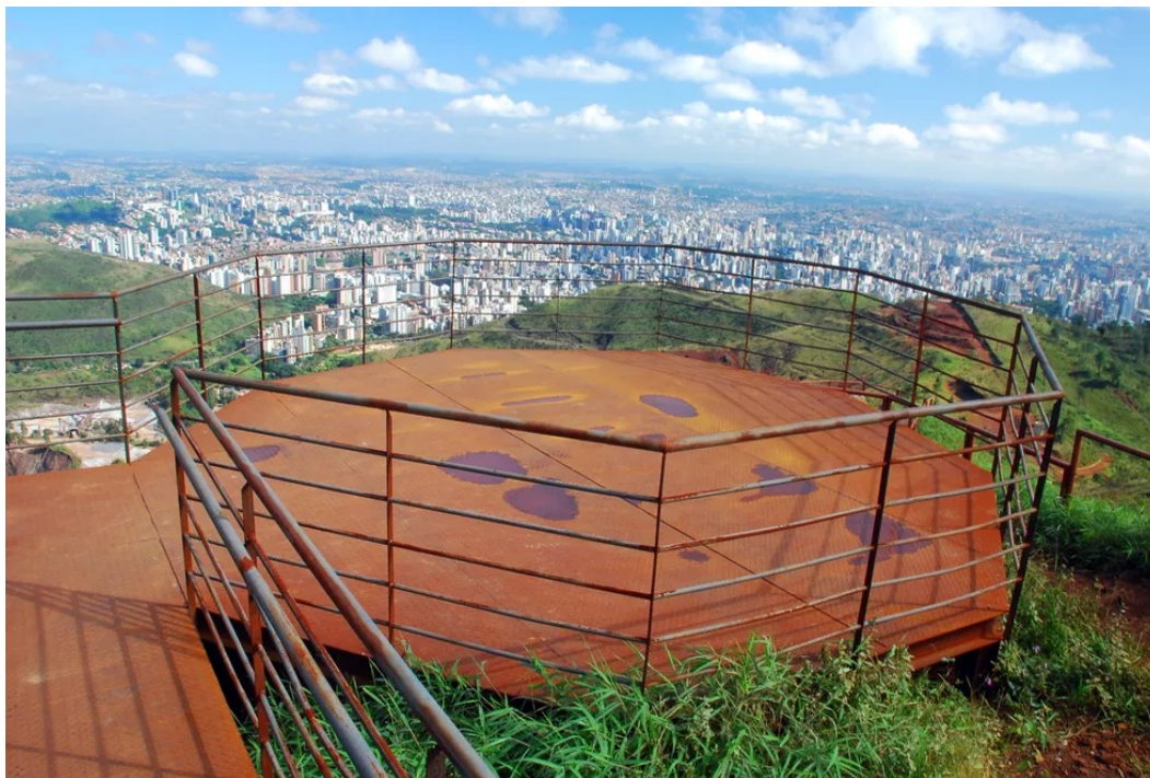
Um dos mirantes do Parque Serra do Curral em BH

O Mangabeiras está situado em uma altitude de mil a 1.300 metros. Ele recebe cerca de 15 mil pessoas por mês.