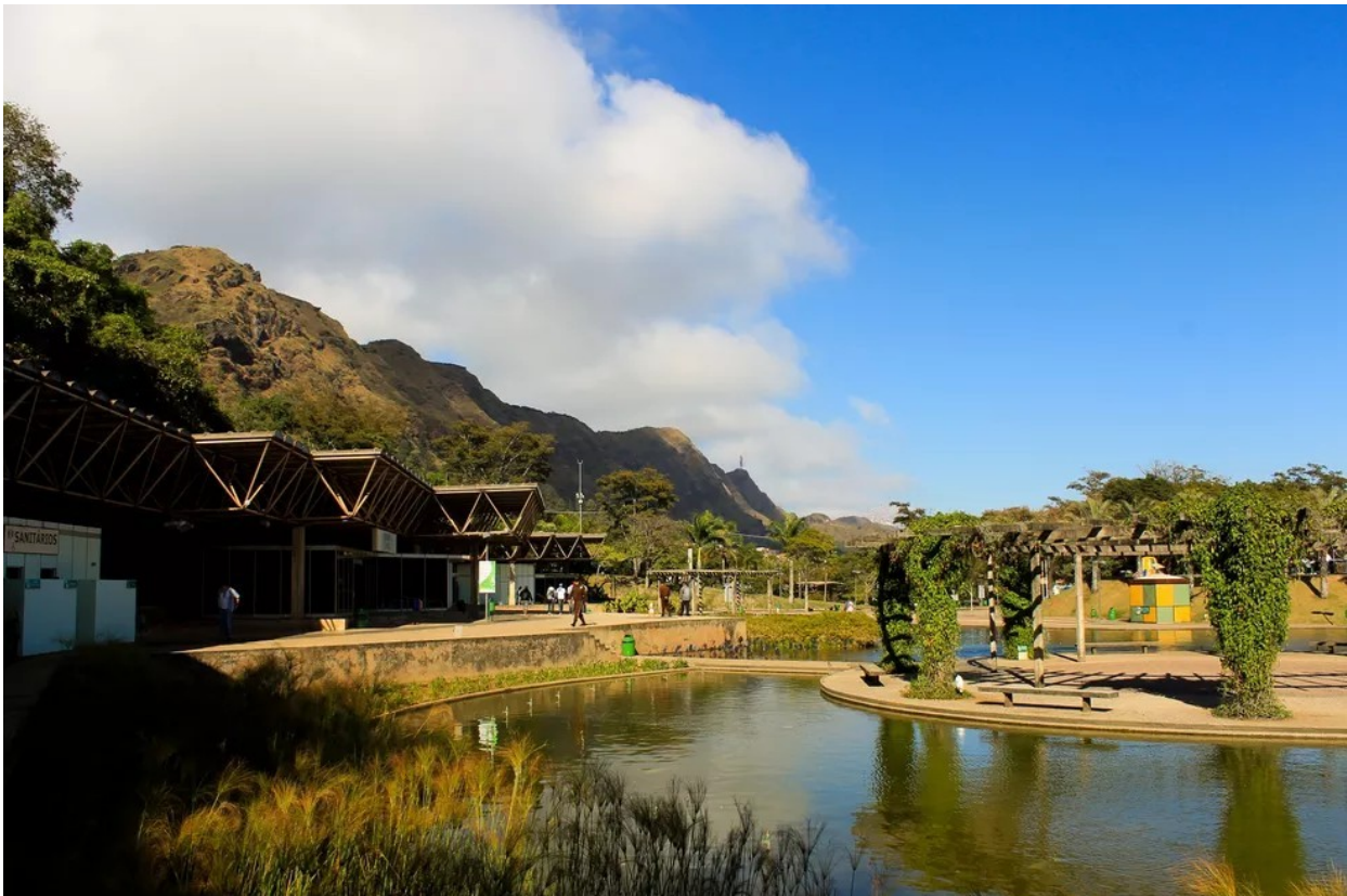
Parque das Mangabeiras em BH