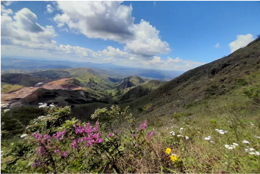
Tamisa pretende instalar complexo minerário na Serra do Curral

O ecossistema da Serra do Curral é rico em fauna e flora. Para se ter uma ideia, há 125 espécies de pássaros catalogados na região.