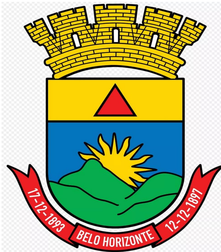
Serra do Curral (em verde) no brasão de Belo Horizonte

A Serra do Curral está representada no brasão de Belo Horizonte. Ela aparece em verde e com um sol nascente à esquerda.