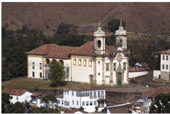
Igreja de São Francisco de Assis, em Ouro Preto

Se a peça foi produzida para adornar a igreja mencionada, ela deveria ter permanecido no local ou encaminhada a um museu público, e não ficar sob domínio de particulares, argumentou.