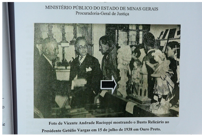
Foto que consta do processo mostra o presidente Getúlio Vargas admirando a obra completa de Aleijadinho, no Instituto Histórico de Ouro Preto