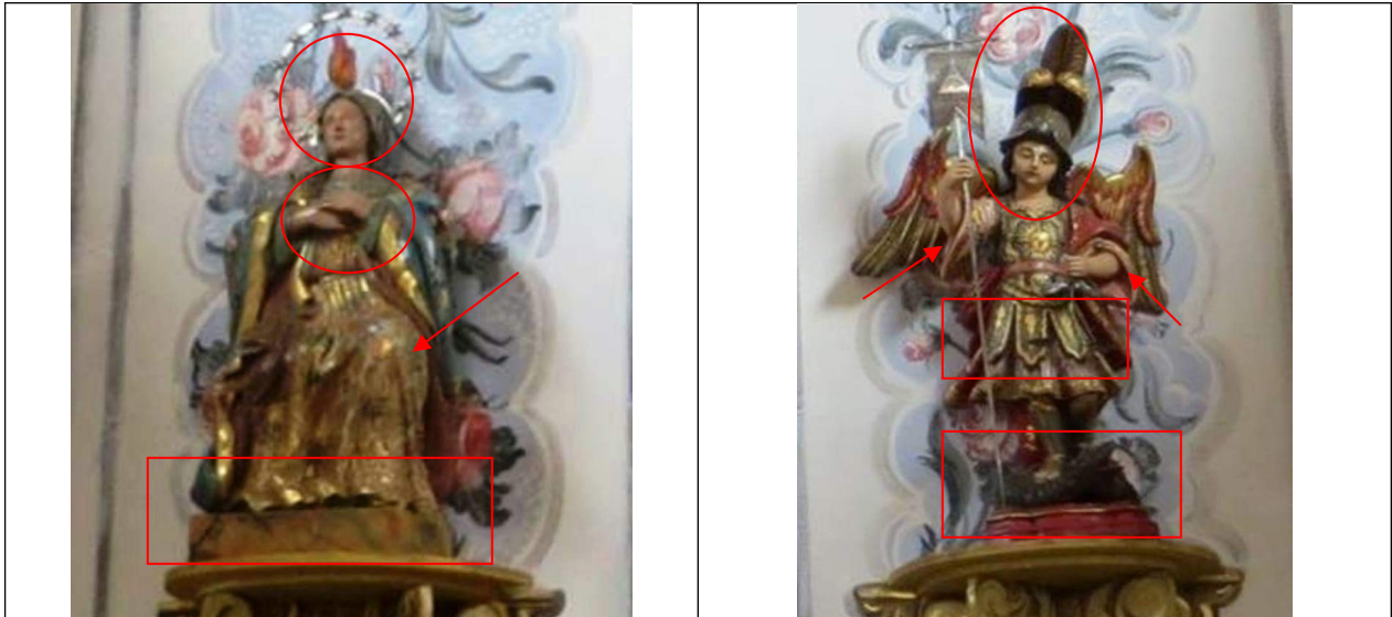
Figuras 02 e 03 – Esculturas de Nossa Senhora de Pentecostes e São Miguel Arcanjo no interior da Capela do Divino Espírito Santo, edificada em São Vicente de Minas – MG.

As esculturas furtadas no município de São Vicente de Minas são as seguintes: