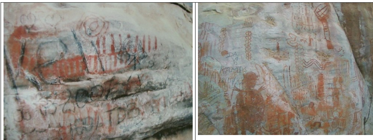
Figuras 06 e 07- Imagens das pichações nas pinturas rupestres da Serra do Pau D'Arco.

Verificamos que os sítios arqueológicos da região estão sendo vítimas de vandalismo e de depredação por parte visitantes. Foram juntadas aos autos imagens que mostram pichações nas pinturas rupestres.