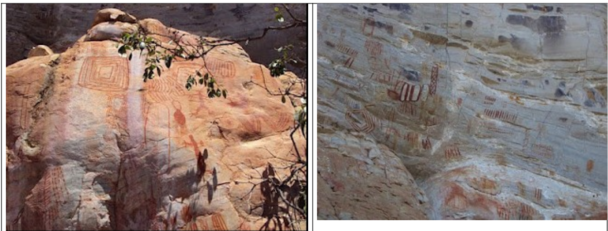
Figura 08 e 09 – Imagens de pinturas rupestres na Serra do Pau D’Arco. Fonte: a2arquiteturaeconsultoria.com.br (imagens registradas durante a Jornada Mineira do patrimônio Cultural em Montezuma no ano de 2010). Acesso março 2012.

O IEF reconheceu a importância dos sítios arqueológicos, encaminhando para a diretoria geral do órgão a sugestão de incluir a área em análise no cronograma da Gerência de Criação para aprofundamento dos estudos técnicos que justifiquem a existência de uma Unidade de Conservação.