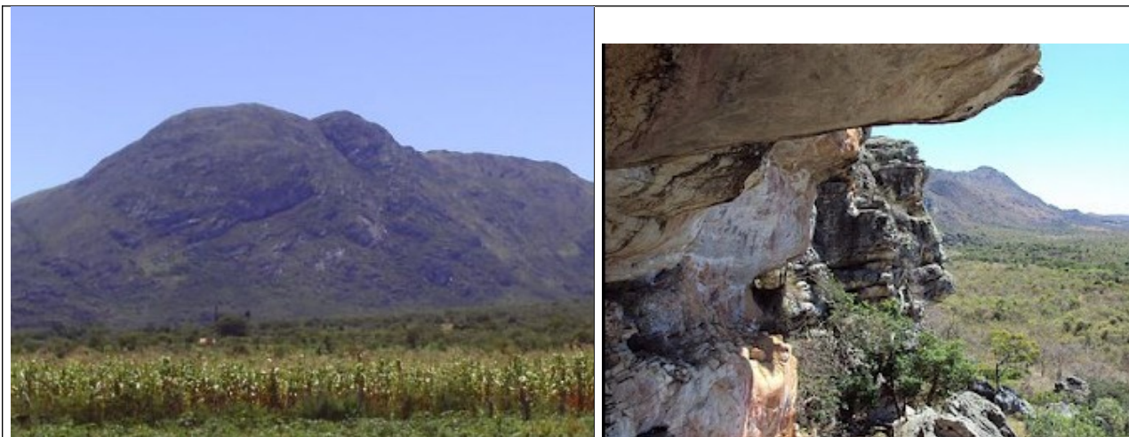
Figuras 04 e 05- Imagens da Serra do Pau D'Arco em Montezuma. Fonte: www.férias.tur.br e a2arquiteturaeconsultoria Ltda.blogspot.com.br , respectivamente. Acesso março 2012.

De acordo com a documentação encaminhada à Promotoria Estadual de Defesa do Patrimônio Cultural e Turístico, verificamos que a região onde se localizam os municípios de Montezuma e Santo Antônio do Retiro apresenta rico potencial arqueológico. A denominada Serra do Pau D'Arco que corta a região possui relevante acervo de pinturas rupestres.