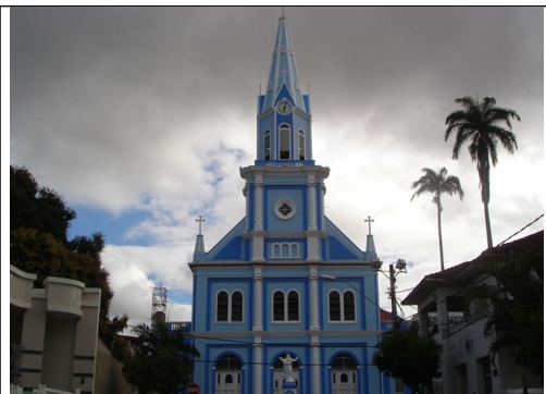
Figura 06- Igreja Matriz de Nossa Senhora da Conceição. Fonte: Site da Prefeitura Municipal. Acesso em agosto de 2011