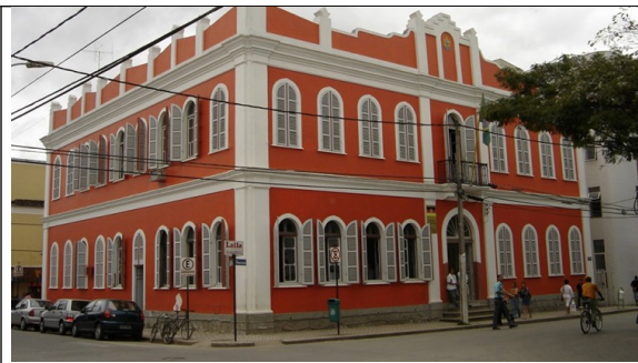
Figura 05-Câmara Municipal de Teófilo Otoni. Fonte: Site da Prefeitura Municipal. Acesso em agosto de 2011