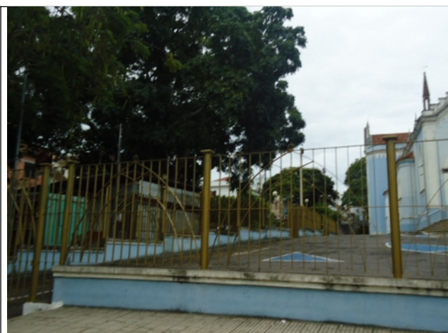
Figura 05 – Trailers na lateral da igreja.

Segundo informações prestadas pelos conselheiros do Conselho de Patrimônio Cultural presentes na vistoria, não houve aprovação daquele conselho para instalação dos trailers.