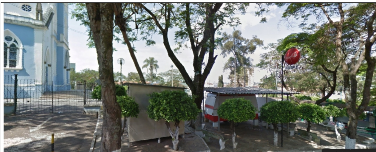
Figura 03 – Imagem do local, com a Igreja Matriz nos fundos.