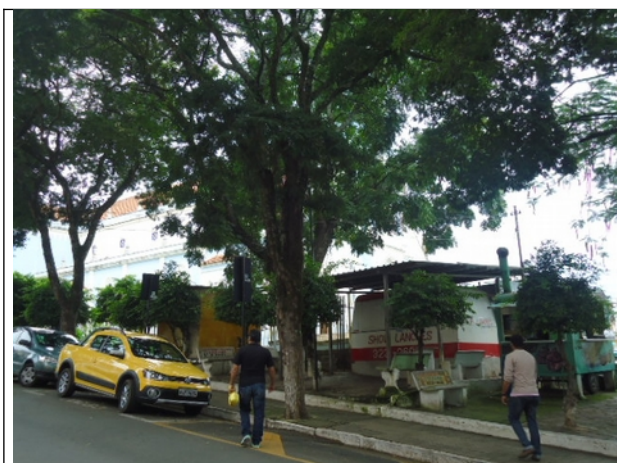
Figura 04 – Imagem dos trailers.