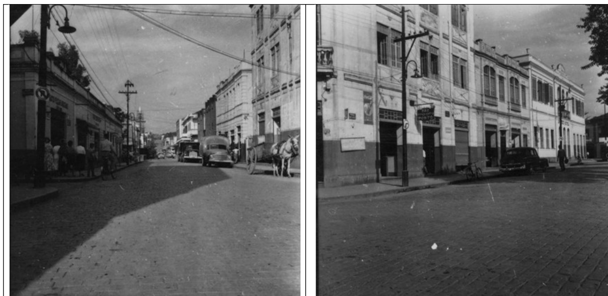
Figuras 03 e 04- Imagens antigas do município de Ubá.