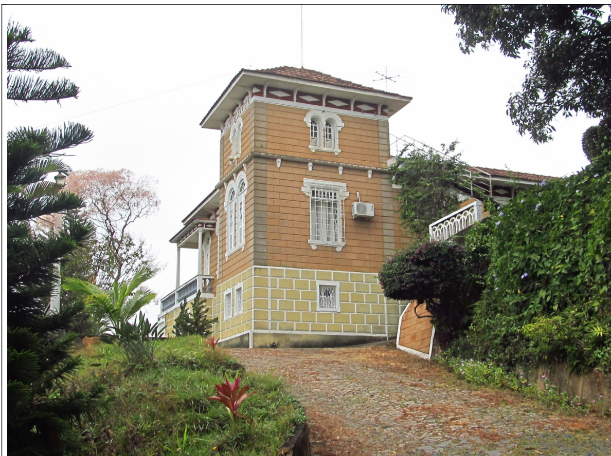
Figura 06 – Fachada da edificação. Foto da vistoria.

Devido à proximidade do centro comercial e de serviços da cidade de Ubá, verifica-se a tendência de substituição das edificações antigas por outras edificações ou com a construção de prédios de apartamentos, revelando uma tendência à verticalização.