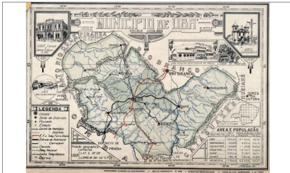
Figura 02- Mapa do município de Ubá.