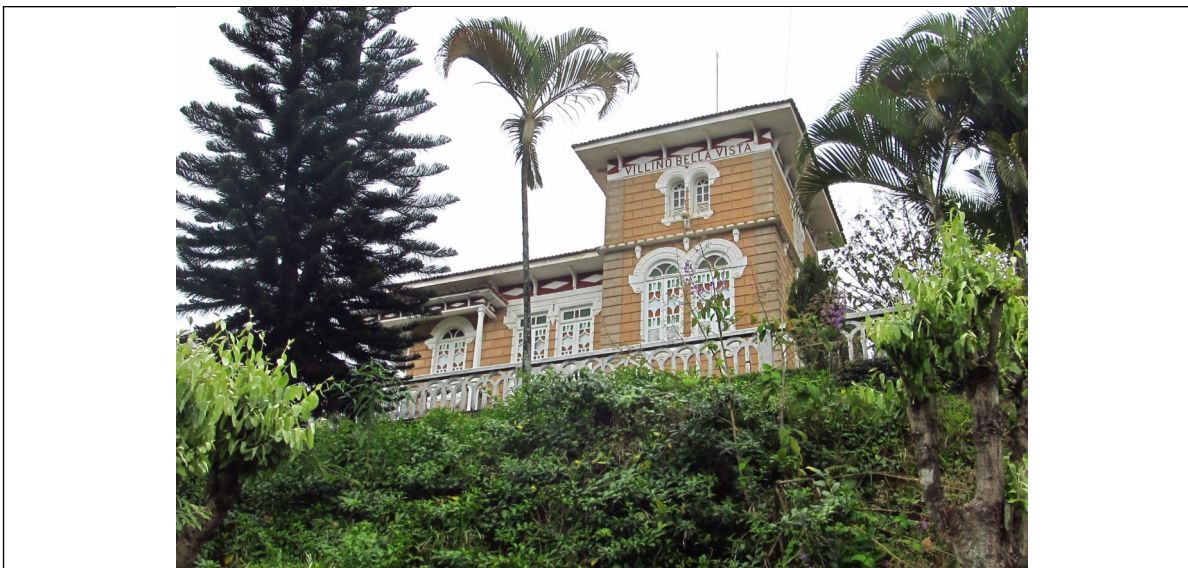
Figura 05 – Fachada da edificação. Foto da vistoria.

Há a inscrição “Villino Bella Vista” no trecho mais alto da edificação, junto ao beiral.