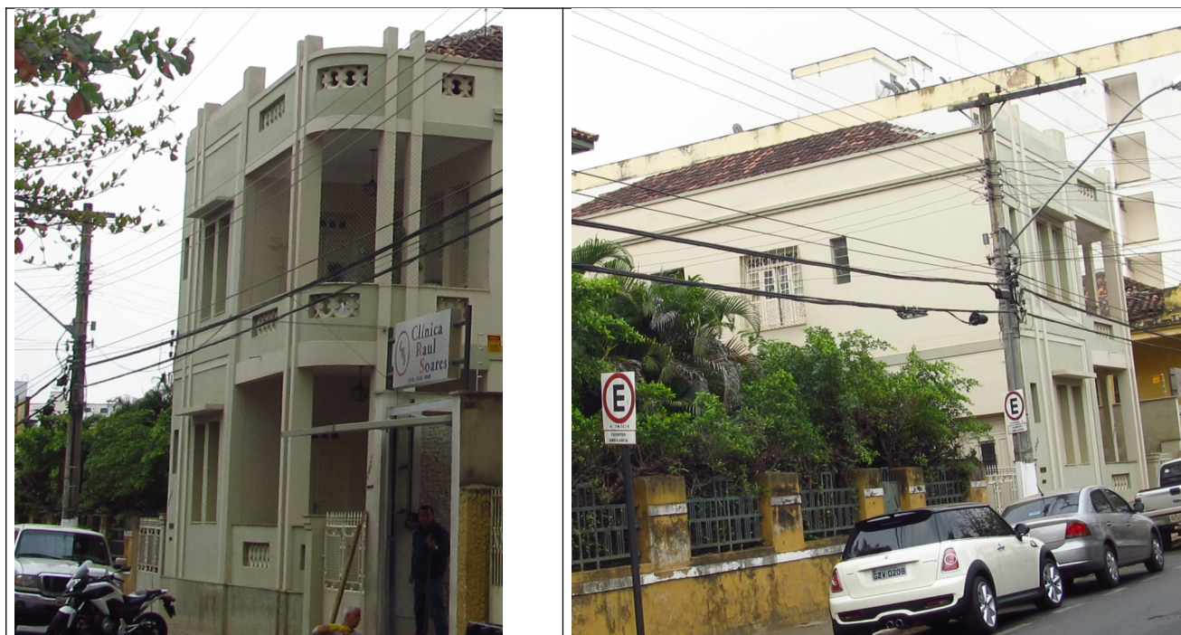
Figuras 06 e 07 – Vistas da edificação localizada na Av. Raul Soares 365. Fotos da vistoria.

A edificação de nº 365 é um exemplar do estilo eclético, com influências art déco , devido à presença de elementos geométricos e linhas ornamentando sua fachada. Desenvolve-se em dois pavimentos e encontra-se implantada no alinhamento da via. O acesso se dá pela lateral do imóvel, através de varanda. O segundo pavimento repete as mesmas características do primeiro pavimento, inclusive no alinhamento dos vãos e presença da varanda lateral. A cobertura desenvolve-se em quatro águas, com cumeeira perpendicular à via, oculta por platibanda. Os vãos possuem vergas retas e são vedados por esquadrias de madeira e vidro.