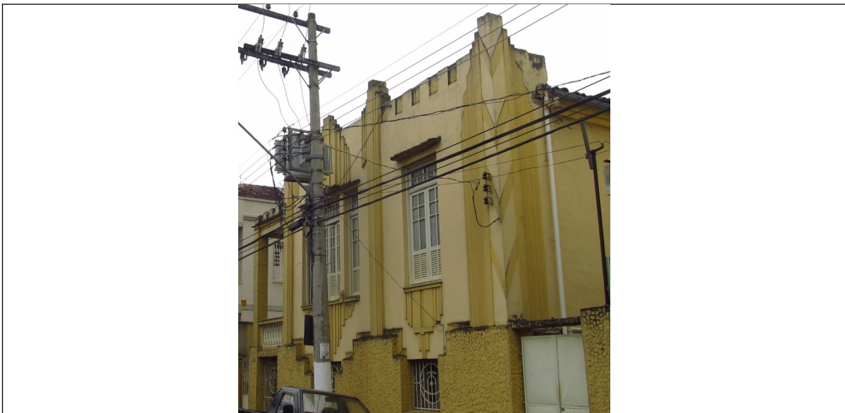
Figura 05 – Fachada da edificação localizada na Avenida Raul Soares 383. Foto da vistoria.

A edificação de nº 383 é um exemplar do estilo eclético, com influências art déco , devido à presença de elementos geométricos e linhas ornamentando sua fachada. Trata-se de edificação térrea implantada no alinhamento da via sobre porão alteado. O acesso se dá pela lateral esquerda do terreno, através de alpendre lateral antecedido por escadaria. A cobertura desenvolve-se em duas águas, com cumeeira perpendicular à via, oculta por platibanda na fachada frontal. Os vãos possuem vergas retas e são vedados por esquadrias de madeira e vidro.