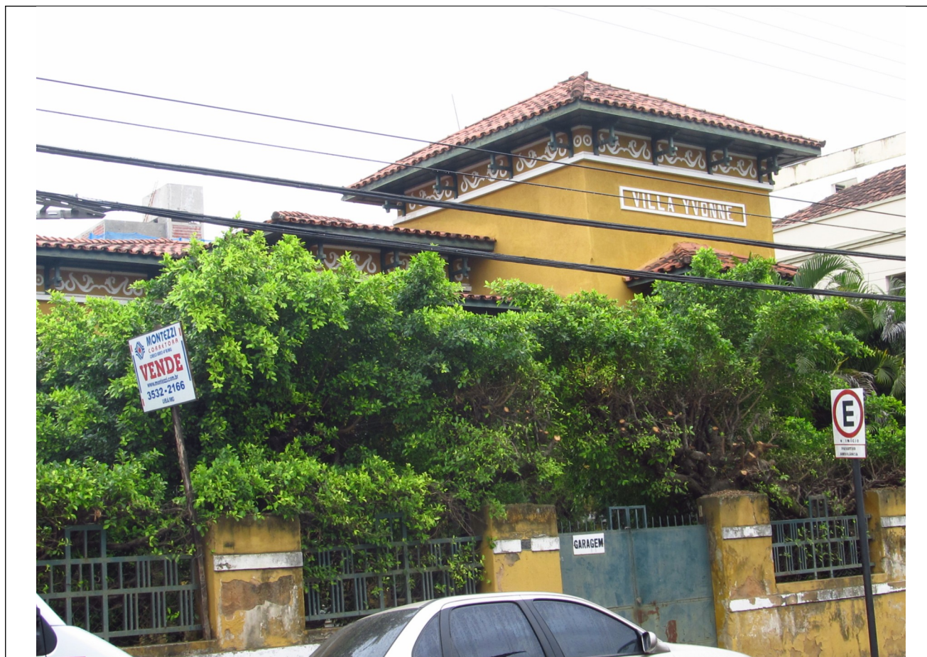
Figura 08 – Fachada da edificação localizada na Av. Raul Soares 345. Fotos da vistoria.

Na data da vistoria verificou-se a tendência de substituição das edificações antigas por outras edificações ou com a construção de prédios de apartamentos, devido à proximidade do centro comercial e de serviços da cidade de Ubá. A Avenida Raul Soares já sofreu várias perdas de exemplares históricos e de valor arquitetônico, que cederam lugar a prédios de apartamentos, de altura considerável.