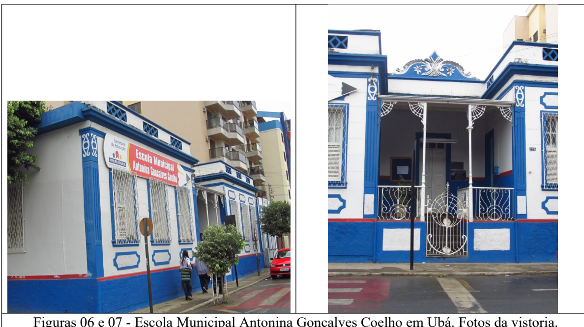
Figuras 06 e 07 - Escola Municipal Antonina Gonçalves Coelho em Ubá. Fotos da vistoria.

Devido à proximidade do centro comercial e de serviços da cidade de Ubá, verifica-se a tendência de substituição das edificações antigas por outras edificações ou com a construção de prédios de apartamentos, revelando uma tendência a verticalização.