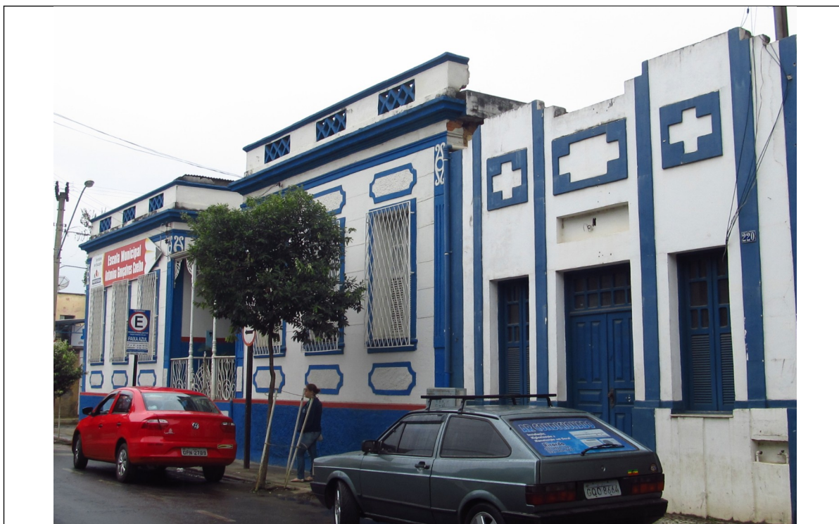
Figura 05 - Escola Municipal Antonina Gonçalves Coelho e anexo lateral, localizados na Av. Raul Soares, nº 226 e 220, respectivamente. Foto da vistoria.