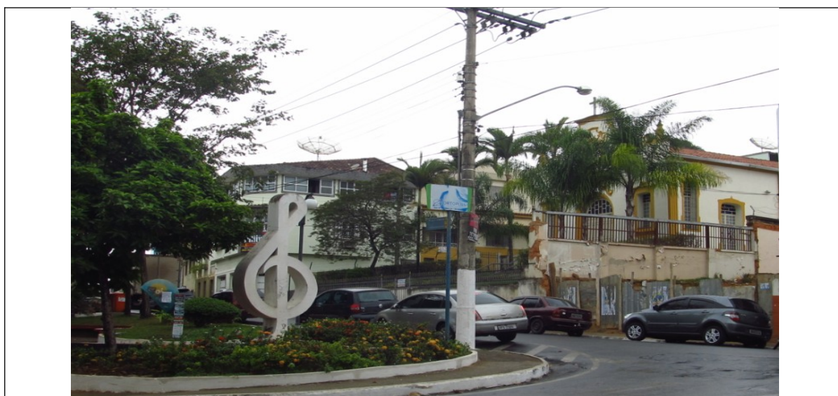
Figura 06- Praça das Mercês, destacando ao fundo a igreja e em primeiro plano o monumento à música. Fotos da vistoria.