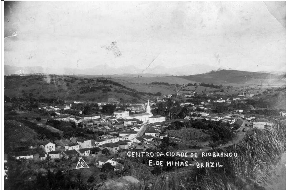
Figura 01 – Imagem antiga do centro da cidade.

lei comumente designada como “do Ventre Livre”, embora sua parte mais importante fosse dedicada a formação de fundos para libertação de escravos.