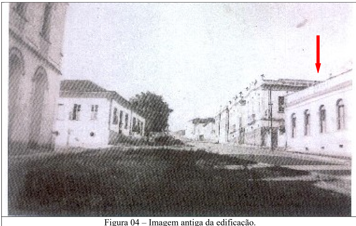
Figura 04 – Imagem antiga da edificação.