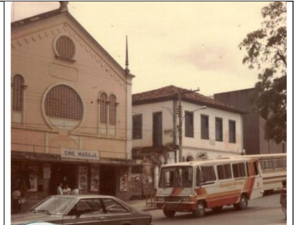
Figura 10 – Antigo Cinema.