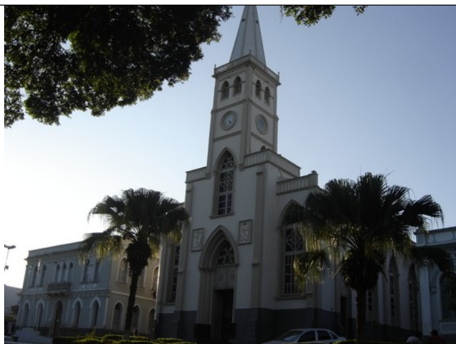
Figura 06 – Igreja Matriz e Prefeitura.