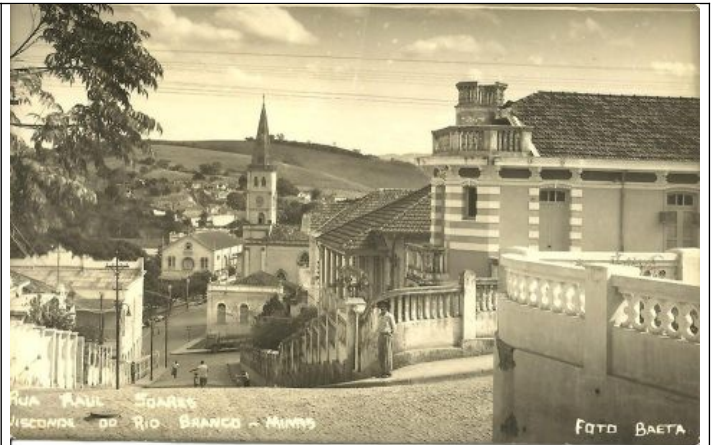
Figuras 02 e 03 - Imagens antigas da cidade.