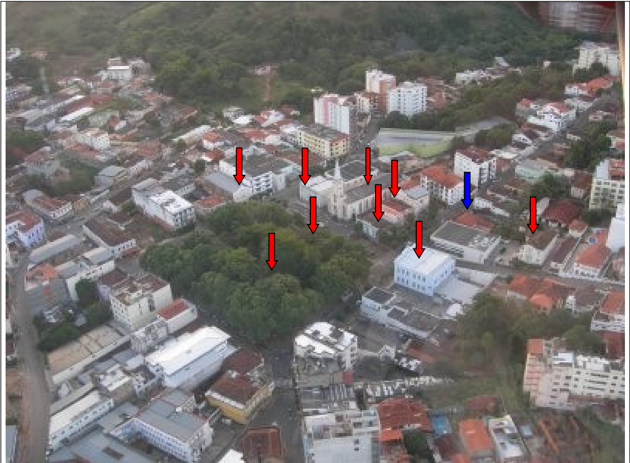
Figura 05 – Imagem aérea demonstrando a proximidade do imóvel em tela dos bens tombados pelo município. As setas vermelhas assinalam os bens tombados e a seta azul o imóvel em questão.