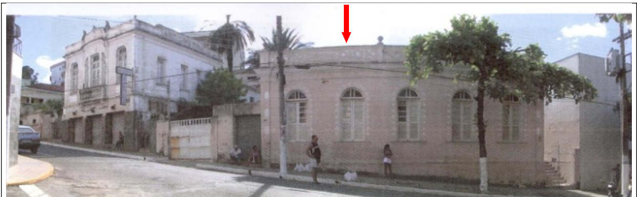
Figura 14 – Imagem do conjunto antes da demolição.

Apesar de inventariado e no perímetro de entorno de bem tombado, a demolição do bem não foi autorizada pelo Conselho Consultivo Municipal do Patrimônio Histórico e Artístico de Visconde do Rio Branco. Em ofício encaminhado à Promotoria de Visconde do Rio Branco, a presidente daquele conselho informa que em reunião realizada foi discutida a intenção do proprietário de promover a demolição das construções existentes e, diante da falta de técnicos a serviço do conselho, foi recomendada a contratação de especialistas para realizarem estudos que fundamentariam futuro posicionamento do conselho. Este estudo não foi elaborado.