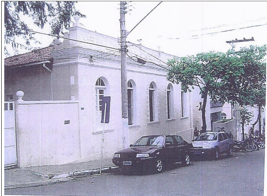
Figura 13 – Imagem constante da ficha de inventário de 2004.