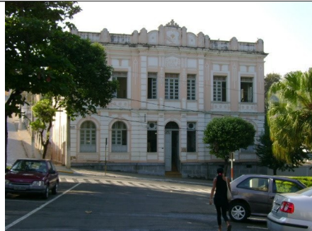
Figura 09 – Escola Estadual dr Carlos Soares