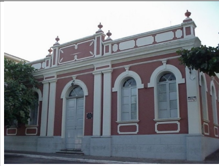
Figura 08 – Sede da Banda 13 de Maio.