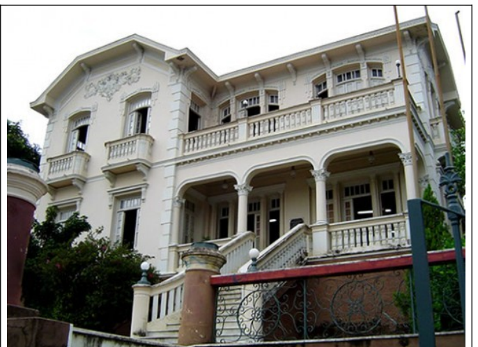
Figura 07 – Conservatório de Música